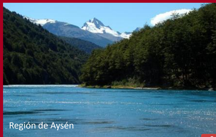
Región de Aysén