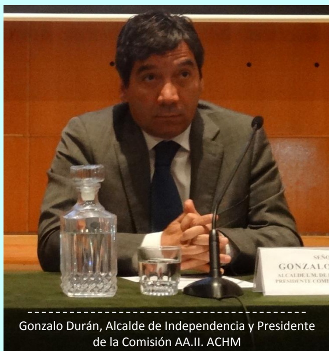
Gonzalo Durán, Alcalde de Independencia y Presidente de la Comisión AA.II. ACHM