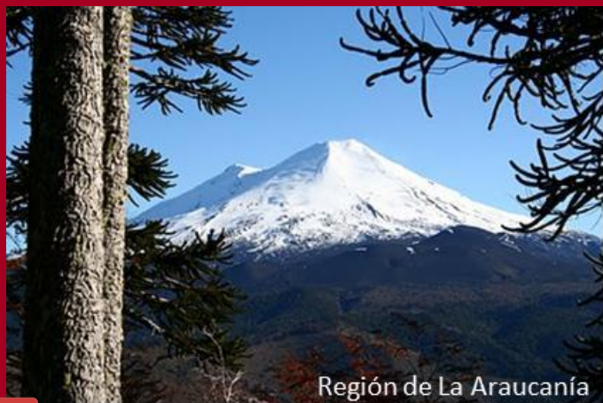
Región de La Araucanía