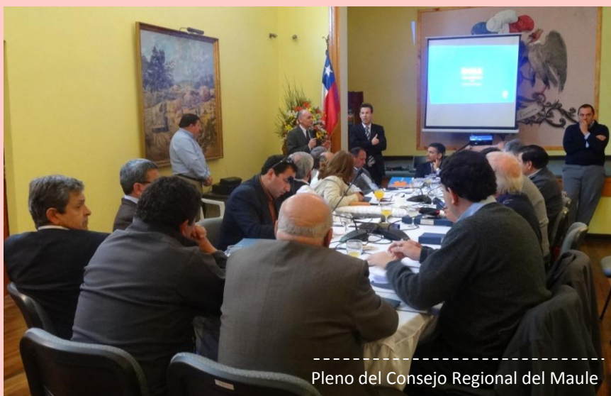
Pleno del Consejo Regional del Maule