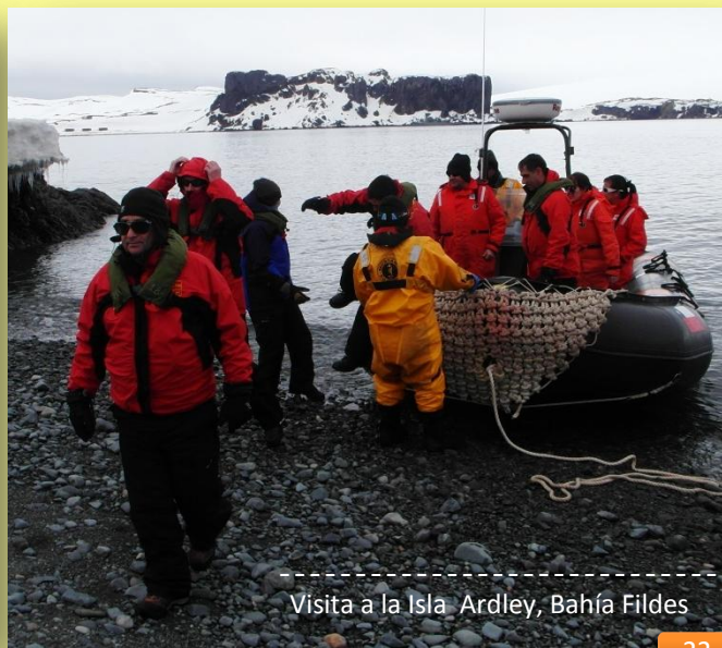
Visita a la Isla Ardley, Bahía Fildes