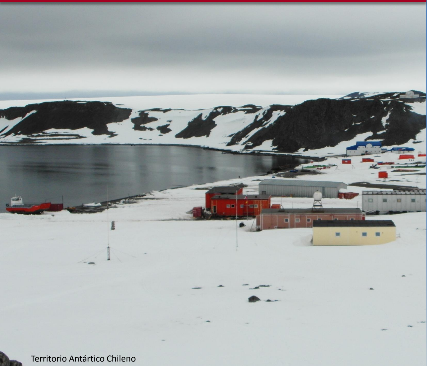
Territorio Antártico Chileno