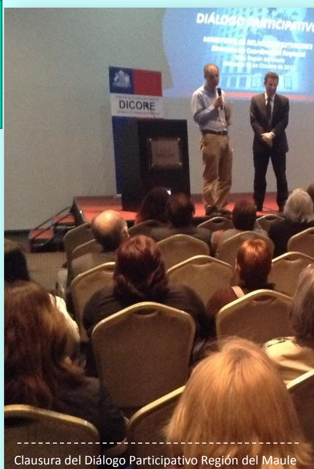
Clausura del Diálogo Participativo Región del Maule