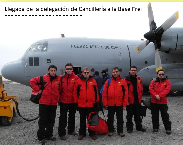
Llegada de la delegación de Cancillería a la Base Frei