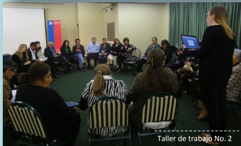
Taller de trabajo No. 2