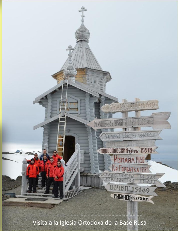
Visita a la Iglesia Ortodoxa de la Base Rusa

Con la visita al Territorio Antártico Chileno se cumple con uno de los objetivos trazados por DICORE en cuanto a realizar actividades en todas las regiones del país y, muy especialmente, en territorios y localidades remotas y con mayores dificultades de conectividad física.