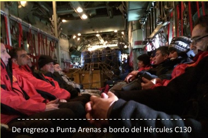
De regreso a Punta Arenas a bordo del Hércules C130