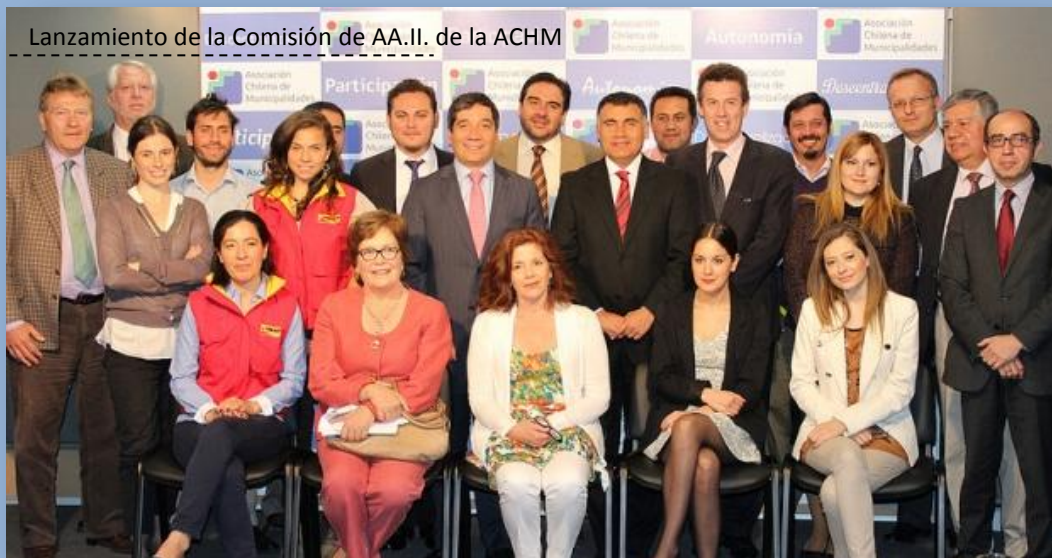
Lanzamiento de la Comisión de AA.II. de la ACHM

La ACHM contaba con una Unidad de RR.II. creada en octubre de 2010, la cual pasó a tener el status de “Comisión de AA.II” el 19 de noviembre de 2013, bajo la presidencia del Alcalde de Independencia, Gonzalo Durán (PS), y la vicepresidencia del Alcalde de Maipú, Christian Vittori (DC).