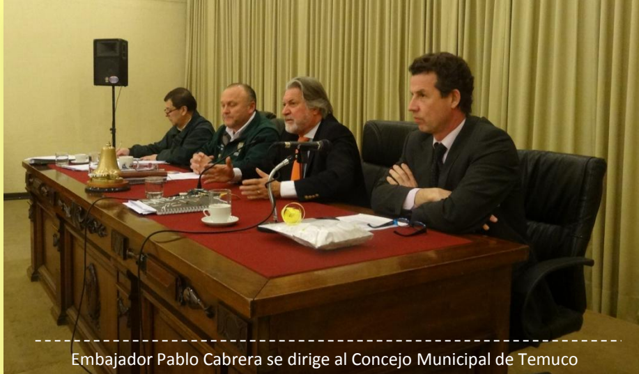
Embajador Pablo Cabrera se dirige al Concejo Municipal de Temuco

El Concejo Municipal de Temuco está presidido por el alcalde Miguel Ángel Becker, y compuesto por 10 concejales. Se reúne en sesiones ordinarias tres veces al mes. Por su parte, las sesiones extraordinarias se realizan una vez al mes o las veces que sea necesario para dar solución a algún tema urgente o cuando la tercera parte de los concejales así lo decida. El alcalde Becker (RN) fue reelecto en la elección municipal de octubre de 2012.