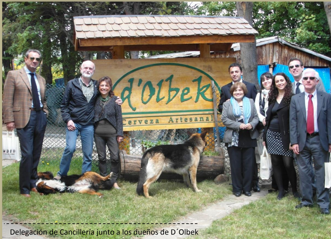
----- Delegación de Cancillería junto a los dueños de D'Olbek

La delegación ministerial visitó la planta de cerveza artesanal "D'Olbek", empresa que es apoyada por ProChile - Aysén en sus esfuerzos para conquistar nuevos mercados. La empresa pertenece a la familia de origen belga Smet d'Olbecke, habitantes de la Patagonia Chilena desde 1948. En la elaboración de la cerveza se ocupa agua pura de la zona.