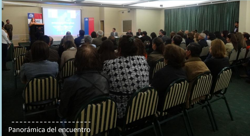
Panorámica del encuentro