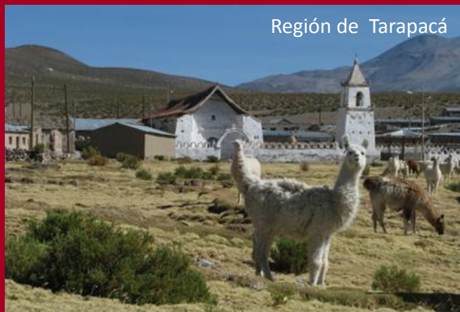
Región de Tarapacá