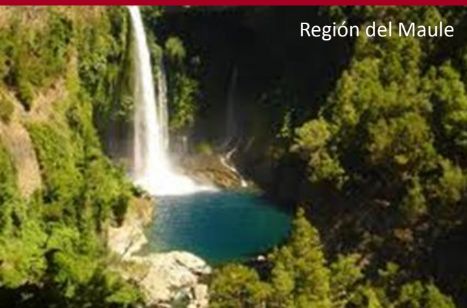
Región del Maule