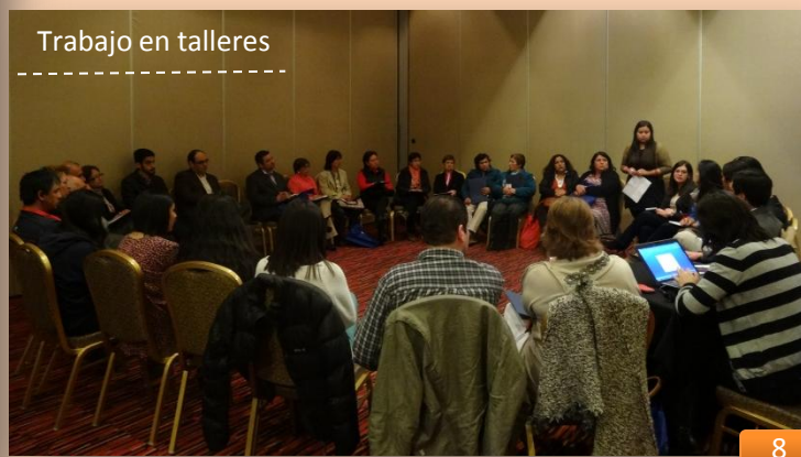
Trabajo en talleres

Más tarde se desarrollaron los “Talleres Participativos”, cuya conducción correspondió a la División de Organizaciones Sociales (DOS). Los asistentes se dividieron en 4 grupos con el objetivo de crear un espacio de opinión en relación a la promoción de la inserción internacional de la región. Al finalizar la jornada, se efectuó un plenario donde cada grupo, a través de un representante, compartió las principales conclusiones del trabajo realizado y que fue sistematizado por los facilitadores de la DOS.