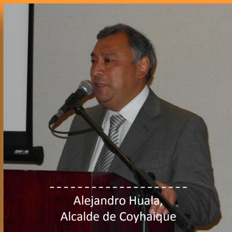
----- Alejandro Huala, Alcalde de Coyhaique