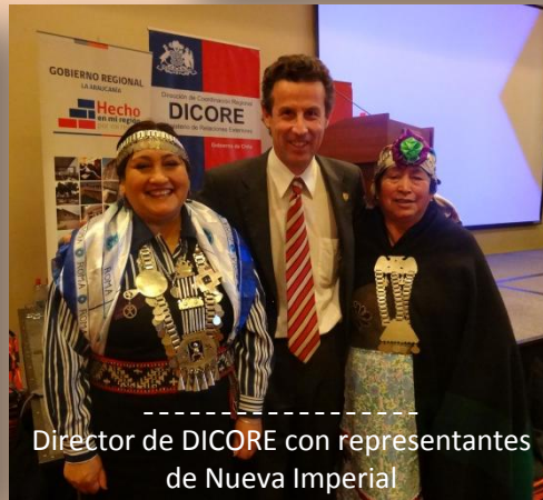
Director de DICORE con representantes de Nueva Imperial